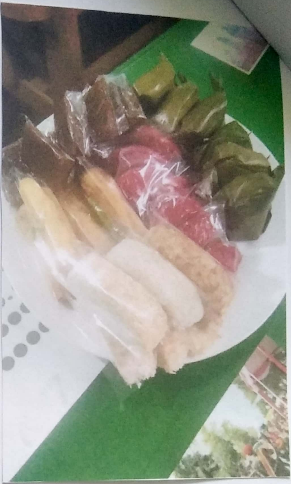
12. Jumat, 14 - 10 - 2022