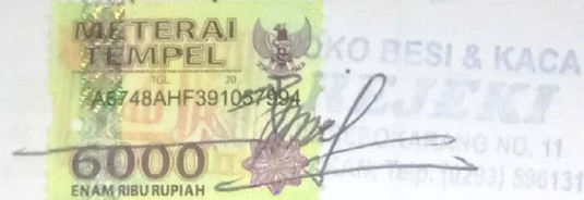
SOEGIJO SIMO WIBOWO